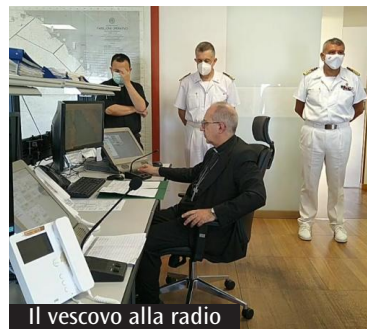
Il vescovo alla radio

«Rivolgo un saluto affettuoso a tutti gli equipaggi - ha detto - per condividere una piccola riflessione e una preghiera». Monsignor Ruzza ha invitato a pregare per il Papa «affinché possa riacquistare presto l'interezza delle forze fisiche e continuare