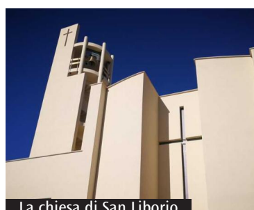
La chiesa di San Liborio

Un percorso che nelle scorse settimane ha coinvolto anche i ragazzi del quartiere che hanno preso parte al campo scuola proposto proprio negli spazi parrocchiali. Per la prima volta, la comunità