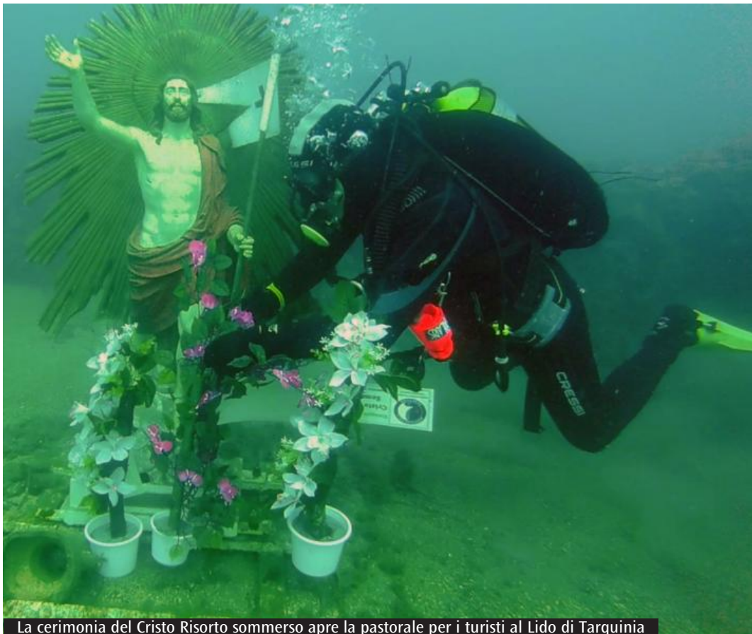
La cerimonia del Cristo Risorto sommerso apre la pastorale per i turisti al Lido di Tarquinia

L'evento vedrà la partecipazione delle Associazioni Nautiche del Lido Assonautica e Vela Club, il supporto tecnico della Protezione Civile di Tarquinia e dei gruppi subacquei locali. Sarà un'occasione in più per apprezzare e prenderci cura di quel mare che ci accoglie ogni