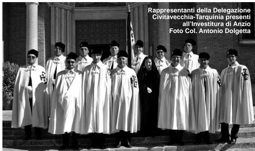
Rappresentanti della Delegazione Civitavecchia-Tarquinia presenti all'Investitura di Anzio