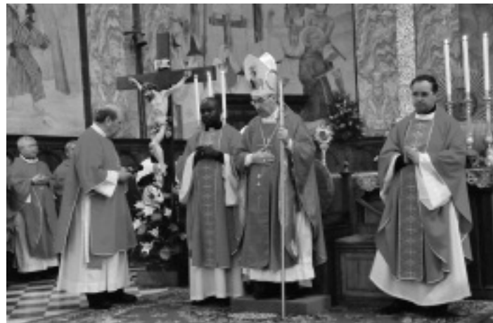
Un momento della celebrazione

Bellissimo l'altare in rosso: rosso il colore dei paramenti sacri dei sacerdoti, rosso e bianco i colori dei fiori che addobbavano la chiesa, rosso il colore del martirio. Ed il martirio è stato l'argomento dell'omelia, ma il martirio come dono, come rinascita in Cristo, come testimonianza di una