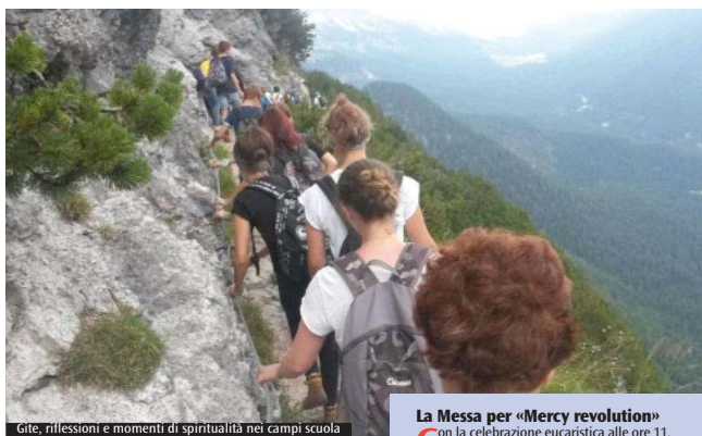
Gite, riflessioni e momenti di spiritualità nei campi scuola

Arriva il «Tempo Estate Eccezionale» dieci proposte, tra luglio e agosto, con i ragazzi dai 6 ai 25 anni