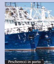
Pescherecci in porto